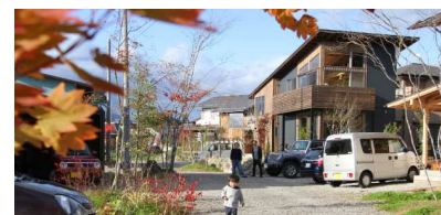
■第1弾「杜くらし根白石」 住所：仙台市泉区根白石 宅地：6区画 全体面積：2,290㎡ 販売状況：6区画完売