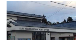
泉根白石郵便局 約1400m