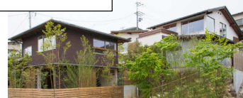
■第0弾「丘の上の提案型住宅」 住所: 仙台市太白区鹿野本町 宅地: 提案型住宅3区画 販売状況: 3区画完売