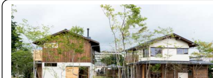
■第2弾「杜くらし愛子中央」住所: 仙台市青葉区愛子中央 宅地: 5区画(うち宅地3区画、提案型住宅1区画、販売型モデルハウス1区画) 全体面積: 1,063.51㎡ 販売状況: 宅地3区画完売、提案型住宅完売