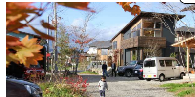
■第1弾「杜くらし根白石」 住所: 仙台市泉区根白石 宅地: 6区画 全体面積: 2,290㎡ 販売状況: 6区画完売